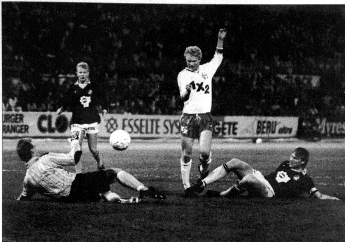
Första derbymålet på Söderstadion.