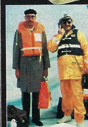
SOS, en segel- sällskapsresa – 1988.