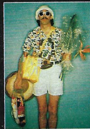
Sällskapsresan – 1980.

■ Sådan är dresen fram till slutet av 70-talet, då de grönvita färgerna åter tas fram.