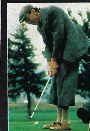
Den ofrivillige golfaren – 1991.