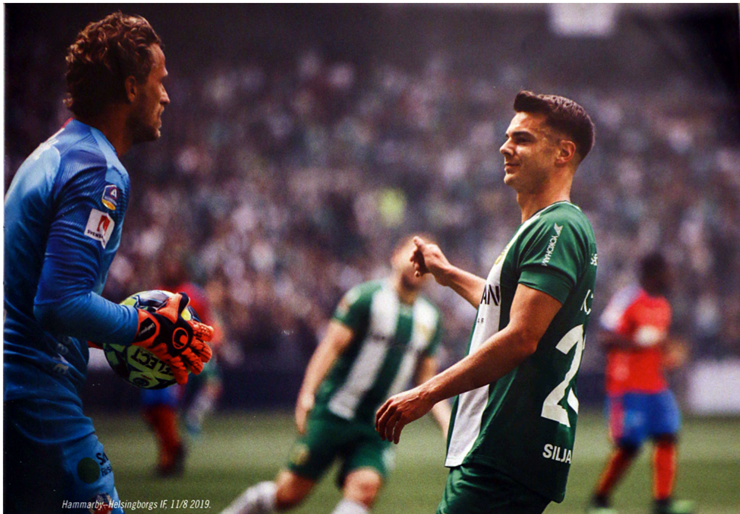
Hammarby–Helsingborgs IF, 11/8 2019.

egentligen tycker jag inte att det ska hända på den här nivån.