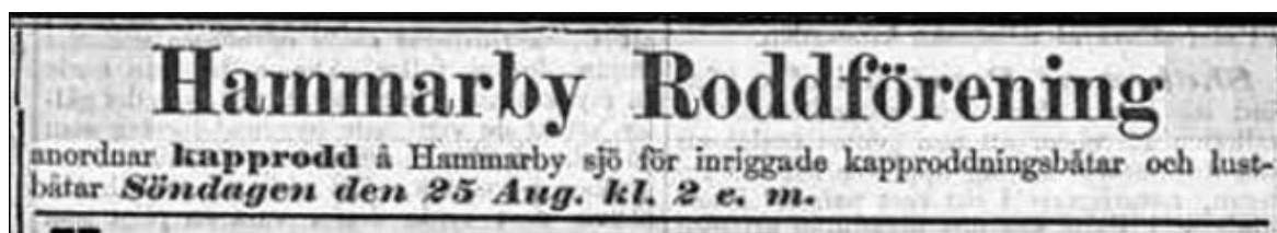
Annons inför Hammarbys regatta den 25 augusti 1889.

Familjeläktaren, sektion 330 gabriel.gemmel@gmail.com