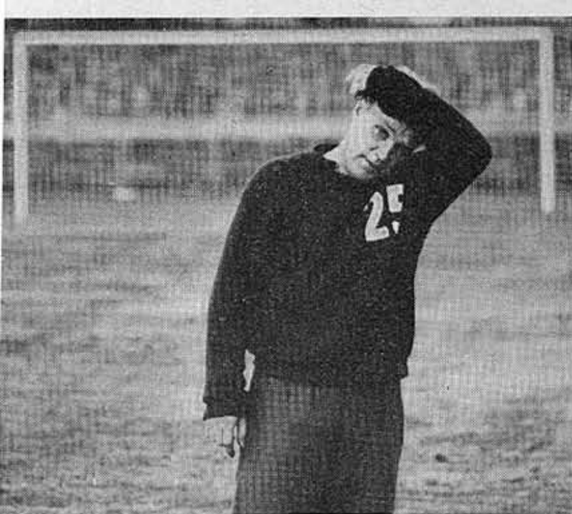
»Det är lite knackigt med flåset än så länge, men det ska bli bättre...»