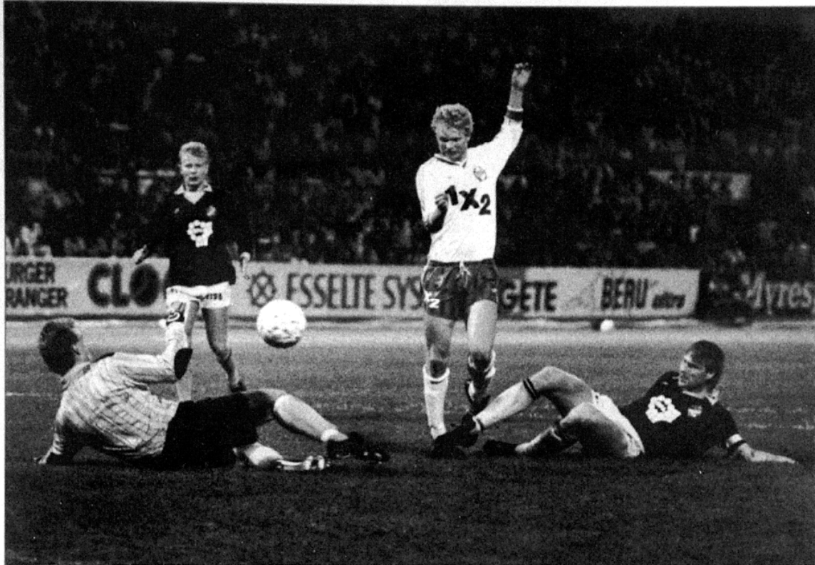
Första derbymålet på Söderstadion.