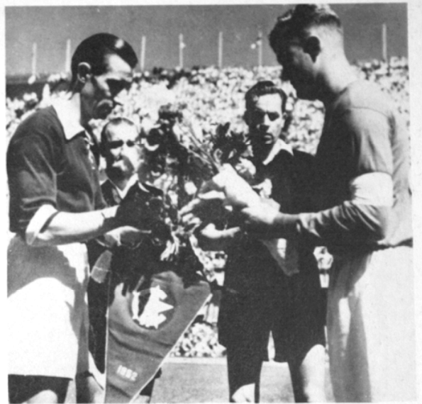
Olympiastadion i Helsingfors: Finland mot Sovjet. Domare: Sten R Ahlner.

— Min säkraste trunkbärare då var försten Ru-